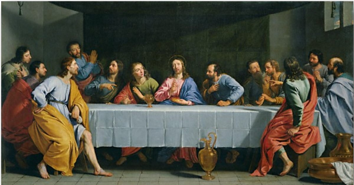
La Cène, dite La Grande Cène par Philippe de Champaigne, France (vers 1662)